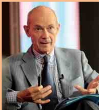
Pascal Lamy Directeur général de l'OMC

«Nous estimons que cette étude est une initiative utile et opportune, qui aidera à mieux comprendre les liens complexes entre le commerce et l'emploi dans les pays en développement.»