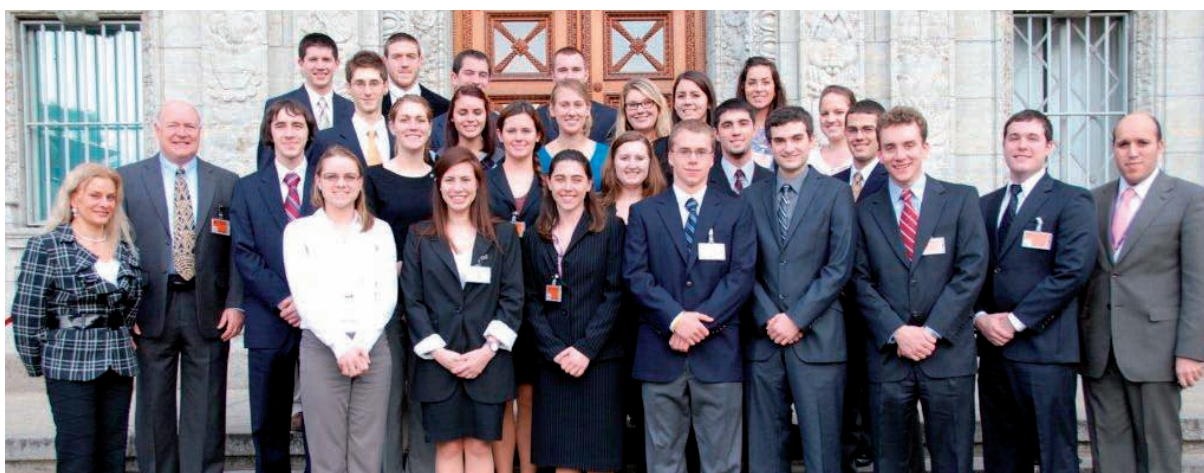
Groupe d'étudiants de l'Université du Delaware