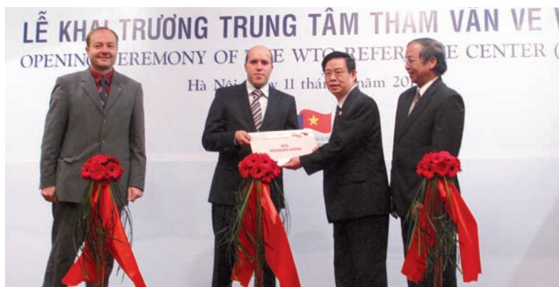
Cérémonie d'inauguration du centre de référence à l'Institut vietnamien du commerce.

Parallèlement à l'ouverture du CR, une formation a été organisée pour le responsable et des hauts fonctionnaires du Ministère de l'industrie et du commerce sur l'accès aux sources d'information de l'OMC,