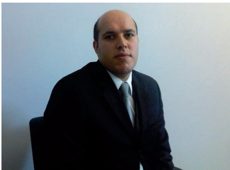
Mustapha Sadni Jallab, Chef, Programme des Centres de référence de l'OMC

Les centres de référence sont souvent considérés comme le moyen le plus pratique et le plus efficace de développer les connaissances et les capacités humaines, car ils permettent aux bénéficiaires de trouver de l'information pertinente sur l'OMC grâce aux services fournis par l'Organisation via Internet. Ils réduisent le fossé dû à l'éloignement géographique entre les capitales et le Secrétariat de l'OMC et, en facilitant la communication, renforcent la participation de tous les Membres aux discussions, aux négociations et à la prise de décisions de l'OMC.