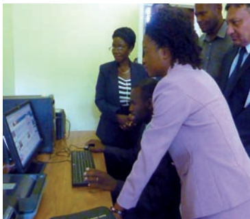
Des universitaires assistent à une présentation au centre de référence.

L'OMC a ouvert un CR au Département d'économie de l'Université de Harare le 22 février 2011. Cet événement a été suivi par un séminaire sur l'OMC et le SCM organisé à l'intention des professeurs des universités du Zimbabwe et de hauts fonctionnaires