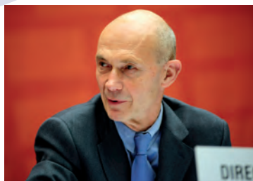
El Director General Pascal Lamy se dirige a la Séptima Conferencia Ministerial de la OMC

Pero el comercio, aunque necesario, no es suficiente. Por un lado tiene que estar afirmado en “sólidas políticas nacionales”. Por otro, necesita la determinación colectiva de fortalecer el sistema finalizando la Ronda de Doha. Como conclusión, el Director General sorprendió al público citando un proverbio en chino, “Zhong Zhi Cheng Cheng”, “La unión hace la fuerza”, y manifestó la esperanza de que “de los próximos días salgamos más fuertes, más unidos y con la clara determinación de concluir la Ronda en 2010”.