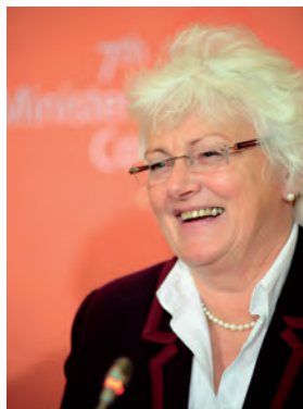
Comisaria Europea Mariann Fischer Boel