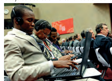
Delegados en la Séptima Conferencia Ministerial

En una conferencia de prensa, el Director General Pascal Lamy expresó su satisfacción por el renovado impulso político que los Ministros habían aportado al sistema. Se adoptaron decisiones sobre la prórroga de las “moratorias” sobre el comercio electrónico y la propiedad intelectual hasta la próxima Conferencia Ministerial, que se celebrará en 2011.