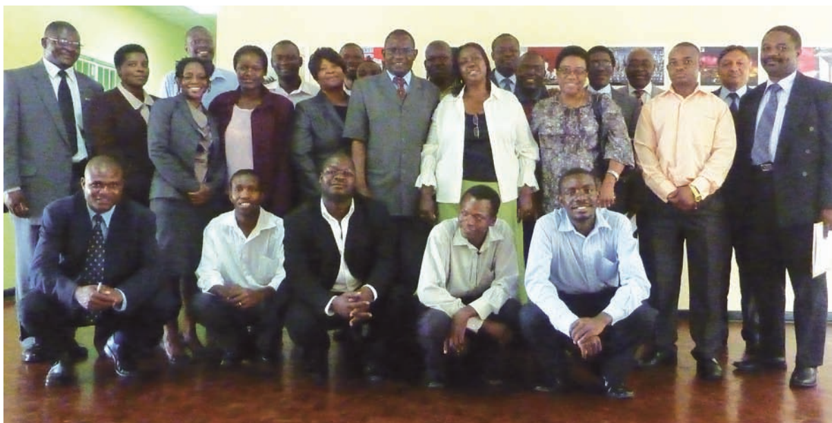
Participantes en la formación impartida con ocasión de la inauguración del CR de la OMC

Resulta muy claro que las relaciones de la Universidad con la OMC se ha iniciado de manera muy positiva, teniendo en cuenta el seminario