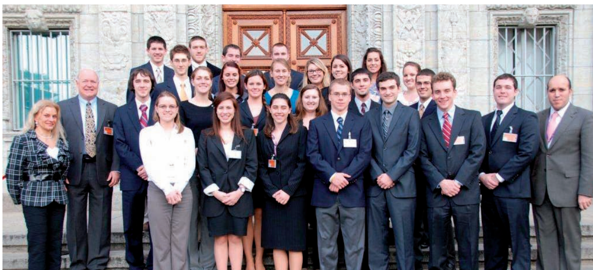
Grupo de estudiantes de la Universidad de Delaware