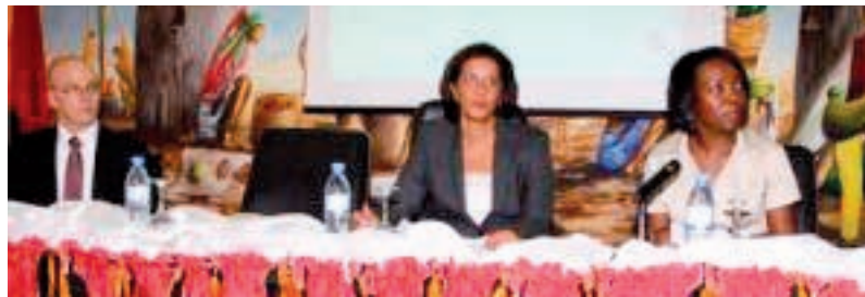
Inauguración del seminario nacional por la Ministra de Comercio Idalina Valente

se abordaron temas de particular importancia para Angola, como por ejemplo la agricultura, el Acceso a los Mercados para los productos no agrícolas (AMNA), la facilitación del comercio, el comercio y el medio ambiente, la Ayuda para el Comercio y el Marco Integrado mejorado. Se facilitó información adicional sobre la OMC y el sistema multilateral de comercio, la participación de Angola en la OMC y la función del Grupo Africano. En estas reuniones se utilizó, como apoyo, una presentación sobre la localización de información pertinente sobre estos temas mediante los distintos recursos de la OMC, incluidos el sitio Web, Documentos en Línea y el catálogo de la biblioteca.