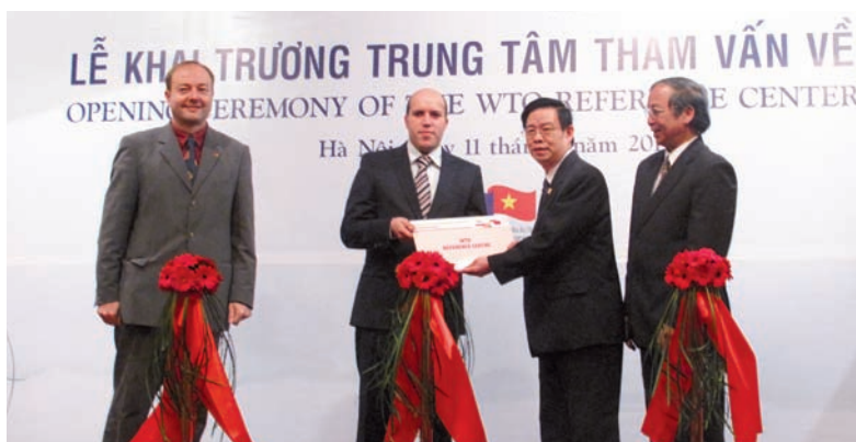
Ceremonia de inauguración del Centro de Referencia en el Instituto de Comercio de Viet Nam

De forma paralela al establecimiento del CR se compartió formación al director del Centro y a funcionarios superiores del Ministerio de Industria y Comercio sobre el acceso a los recursos de información de la